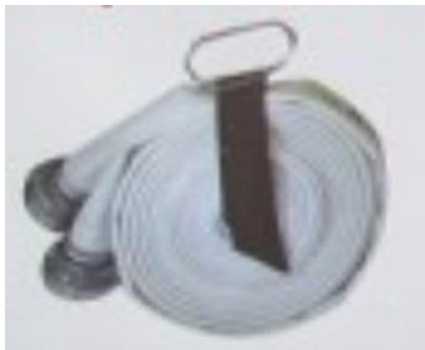
8. Wąż spięty noszakiem