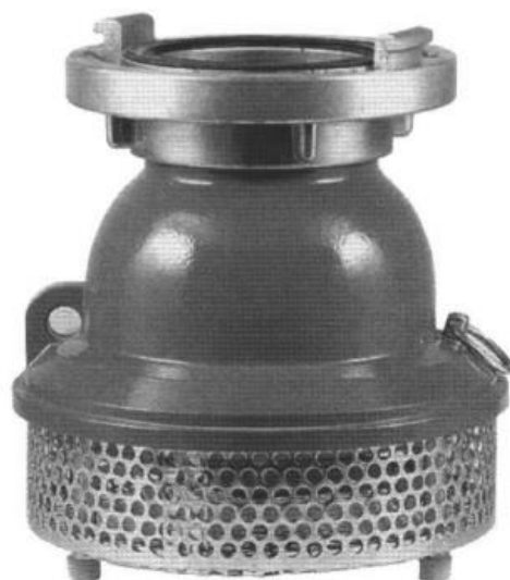
6. Smok ssawny prosty