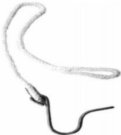
2. Podpinka pętlowa (węzowa)