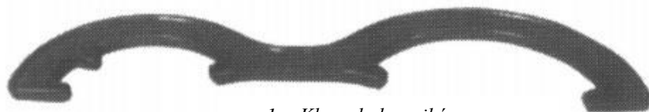
1. Klucz do łączników