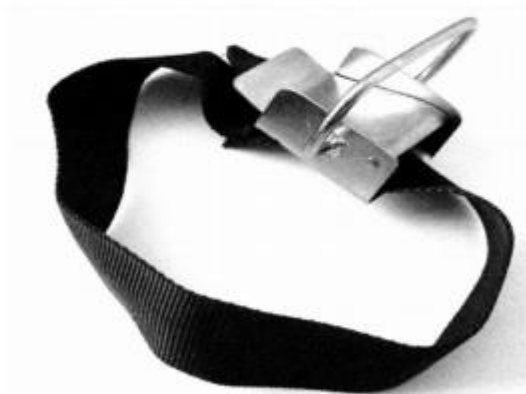
3. Noszak do węży